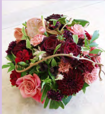
M05 <生花アレンジメント>