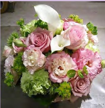
M04 <生花アレンジメント>