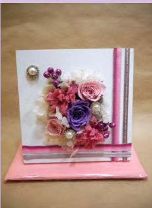
M07 <プリザーブドフラワー>