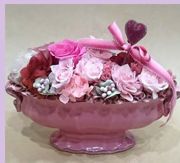
M08 <プリザーブドフラワー>