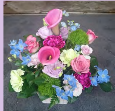
M06 <生花アレンジメント>